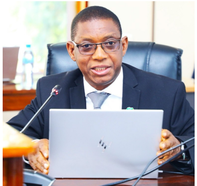
Gavana wa Benki Kuu ya Tanzania (BoT), Bw. Emmanuel Tutuba akitoa wasilisho kwa wajumbe wa Kamati ya Kudumu ya Bunge ya Bajeti.