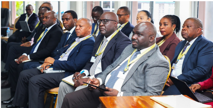
Baadhi ya wakurugenzi na mameneja wa Benki Kuu ya Tanzania (BoT) wakifuatilia wasilisho la Gavana Tutuba kwa Kamati ya Kudumu ya Bunge ya Bajeti.

Kikao hicho kimefanyika ikiwa ni siku 28 tangu kamati za kudumu za Bunge ziundwe na kuchagua viongozi wake.