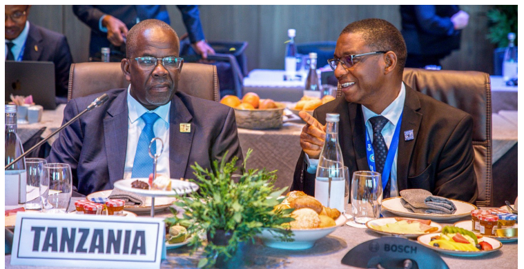
Gavana Emmanuel Tutuba akijadiliana jambo na Waziri wa Fedha, Mhe. Balozi Khamis Mussa Omar (Mb), wakati wa Kikao cha 58 cha Tume ya Uchumi ya Afrika (ECA), kilichofanyika jijini Tangier, Morocco, kuanzia tarehe 28 Machi hadi 3 Aprili 2026.